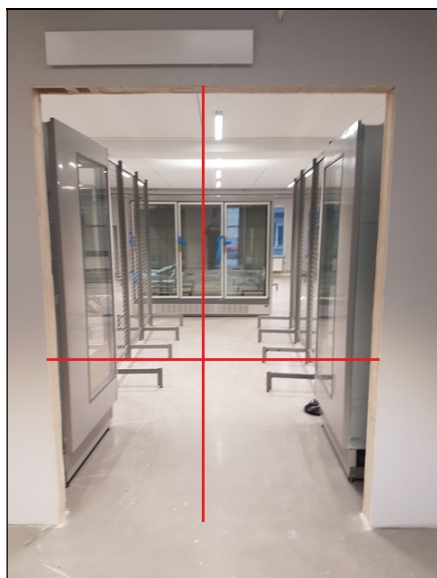
Bredd x Höjd

Börja med att kontrollera att håltagningsmått och väggjocklek stämmer med beställningen.