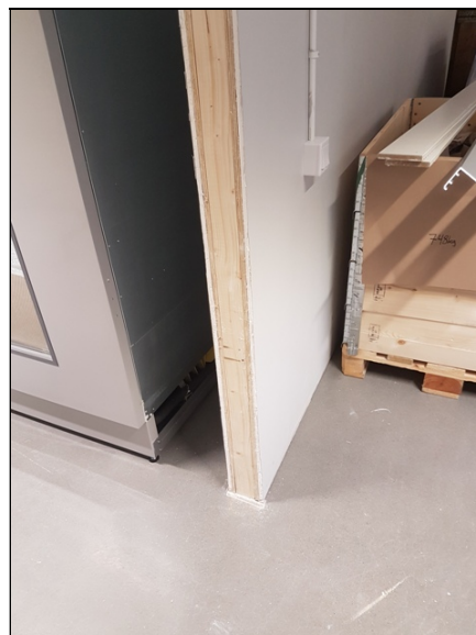
Väggjocklek 70 – 130 mm

Lägg dörrbladet alt. dörrbladen på golvet, på något som skyddar karm mot repor.